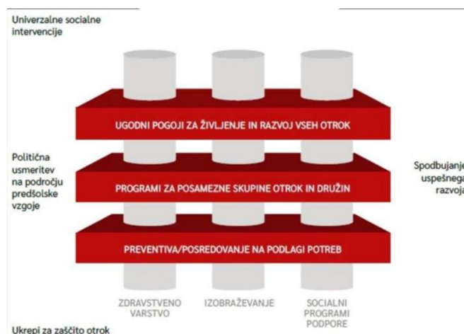
Slika 2: Model PRIMOKIZ

LAT je oblikovan z namenom, da si posamezniki, lokalni koordinator in facilitator izmenjajo dobre prakse, informacije, se učijo drug od drugega, skupno delajo, razvijajo ideje za aktivnosti, oblikujejo situacijsko analizo, pripravijo strategijo, pregledajo obstoječe aktivnosti in dobre prakse, nenazadnje pa tudi skupaj uresničijo zastavljene aktivnosti, ki bodo pozitivno pripomogle k celostni podpori družin z mlajšimi otroki na območju občine ipd.