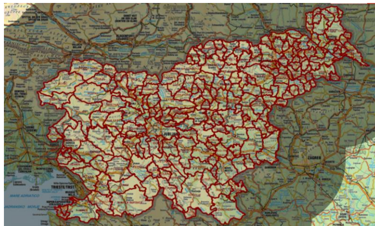
Slika 4: Slovenija